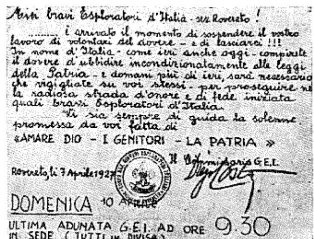
Ultimo documento prima dello scioglimento del distretto di Rovereto - 10 Aprile 1927

Proprio per fronteggiare il pericolo costituito dalle numerose associazioni giovanili non fasciste, il 3 aprile 1926 divenne operante la Legge concernente la istituzione dell'Opera Nazionale Balilla (ONB) per l'assistenza e l'educazione fisica e morale della gioventù . Lo scopo dell'ONB era di farsi carico di una completa educazione della gioventù, compreso l'aspetto religioso, rendendo priva di senso l'esistenza di qualsiasi altra Associazione. Si arrivò dunque al punto di predisporre il piano del primo scioglimento dello Scoutismo, motivato dal pretesto che, in centri abitati piccoli, non potevano esserci ragazzi sufficienti per alimentare più di un'Associazione giovanile: in sostanza, la presenza dell'ONB rendeva inutili gli Scout. Nel 1927, dunque, l'ASCI fu obbligata a chiudere tutti i Reparti nelle località sotto i 20.000 abitanti mentre ai superstiti Reparti fu ordinato di apporre alle proprie insegne uno scudetto con il segno del Littorio e le iniziali dell'ONB.